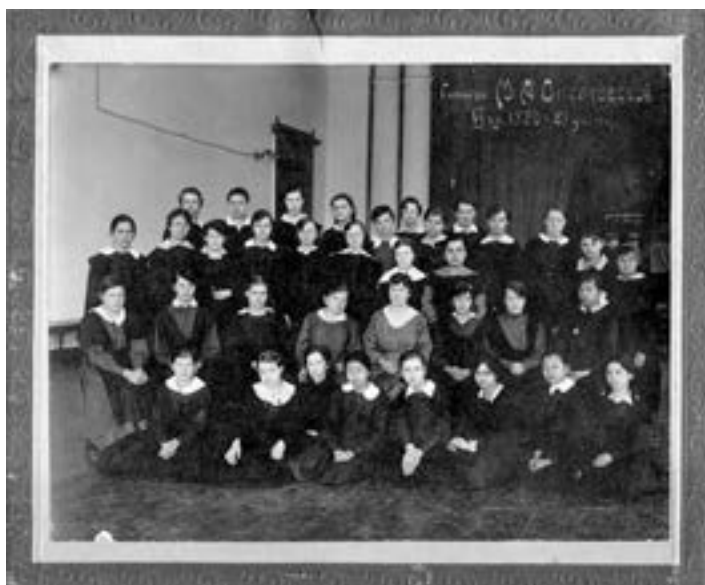
Первые гимназистки женской гимназии М. А. Оксаковской.