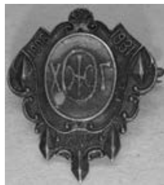
Нагрудный знак гимназии М. А. Оксаковской.

В 1935 году в городе по решению Министерства образования Маньчжоу-Го для детей российских эмигрантов была основана Правительственная гимназия, которая с 1 января 1938 года получила название 4-й Высшей народной школы. По состоянию на 1 марта 1940 года в ней обучались 172 ученика и работали 14 русских и два японских преподавателя, среди которых была лишь одна женщина. В числе служащих канцелярии школы было двое русских, двое китайских и один японский служащий [30]. В числе изучаемых в Высшей народной школе дисциплин были гражданская мораль, Закон Божий, русский, японский и английский языки, история, география, естествознание, математика, технические и графические предметы, технология металлов, музыка, пение, физкультура и производственная практика [27].