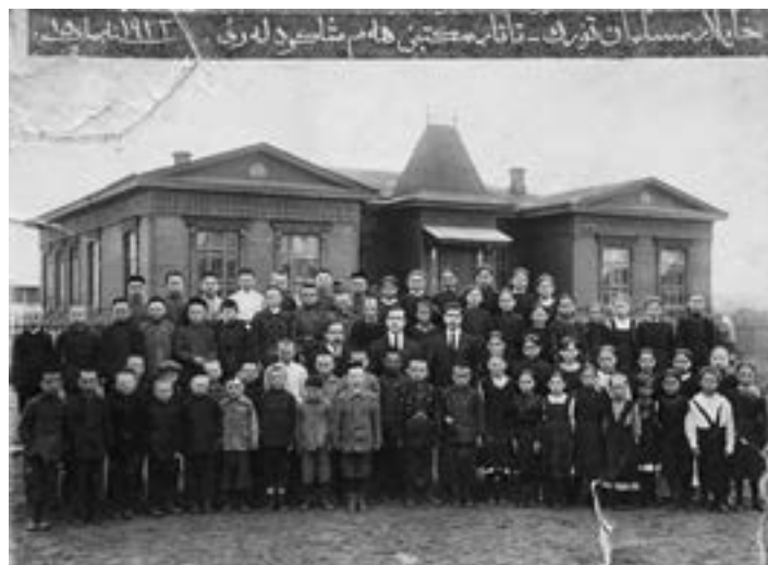
Мусульманская школа в Хайларе. 1923 год.

Довольно крупная диаспора российских эмигрантов в Северо-Восточном Китае существовала в изучаемый период в г. Хайларе. Об этом, в частности, говорит большое количество школьников в изучаемом регионе. Так, в 1940 году в Русской народной школе в Хайларе, имевшей классы повышенной народной школы и гимназии, обучались 128 мальчиков и 135 девочек [25]. В этом учебном заведении работали 13 преподавателей, из которых три человека имели высшее, а 10 — среднее специальное образование.