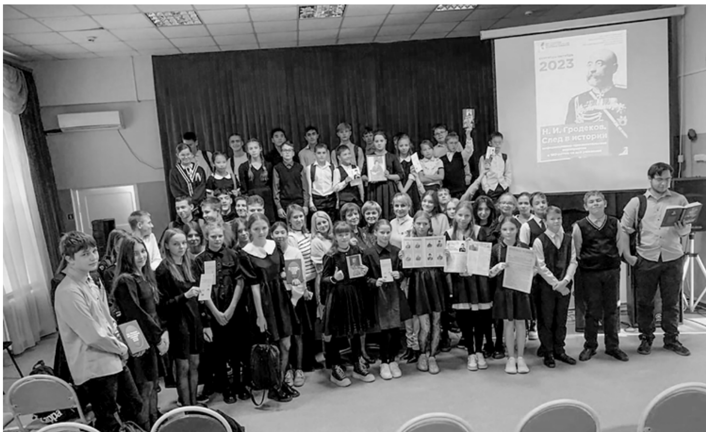
Средняя общеобразовательная школа села имени Полины Осипенко, 23 октября 2023 года.