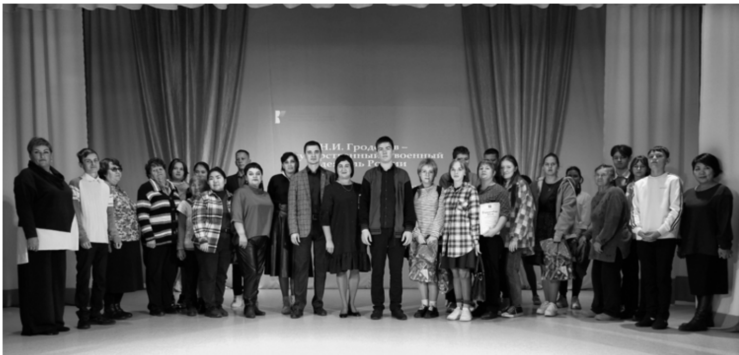
Дом культуры посёлка Молодёжный Комсомольского муниципального района, 6 октября 2023 года.

Проект завершается в 2023 году. Созданный в результате его реализации электронный ресурс размещён на сайте главного партнёра проекта — Дальневосточной государственной научной библиотеки. Печатная книга поступила в фонды общедоступных библиотек и библиотек