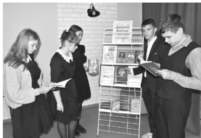
Центральная районная библиотека администрации Бикинского муниципального района Хабаровского края. Бикин, 27 сентября 2023 года.

Просветительские мероприятия, посвящённые 180-летию со дня рождения Н. И. Гродекова, были проведены во всех городских округах и муниципальных районах Хабаровского края, в Благовещенске и Биробиджане.