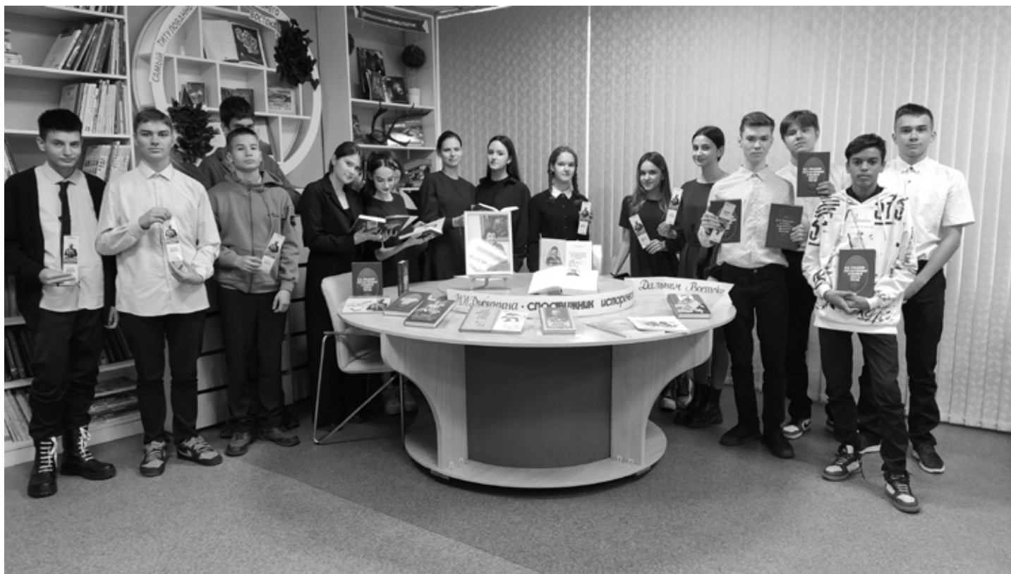
Центральная модельная библиотека посёлка Чегдомын, 18 октября 2023 года.

Материал поступил в редакцию 13.11.2023.