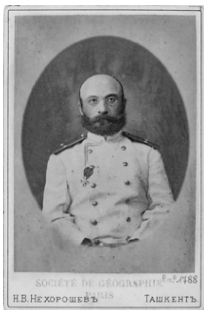
Николай Иванович Гродеков. Ташкент, 1887 год.

С 1893 по 1902 год Н. И. Гродеков служил в Приамурье, где сначала исполнял обязанности помощника приамурского