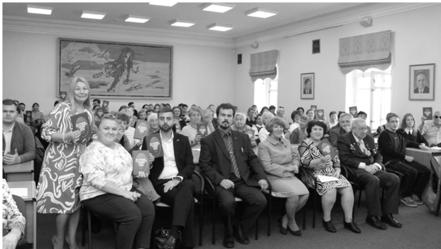
Презентация книги и цифрового ресурса в Дальневосточной государственной научной библиотеке. Хабаровск, 14 сентября 2023 года.

В рамках реализации проекта был проведён цикл информационно-просветительских мероприятий, целью которых стало продвижение и популяризация созданных информационных продуктов.