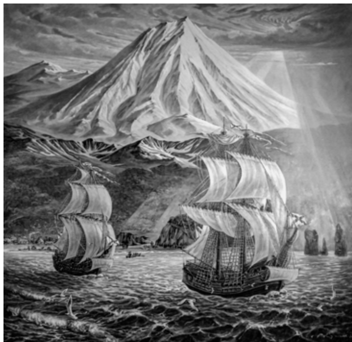
В. Ефимов, «К новым берегам».

Он написал портреты В. Беринга, А. Чирикова, портреты команды экспедиций. Работая над историческими портретами, художник изучал экспозиции музеев Дании, городов Санкт-Петербурга, Москвы, Якутска и Петропавловска-Камчатского. Время не оставило образов первопроходцев, поэтому они были созданы по представлению художника. Одной из трудных задач для него было воссоздание внешнего вида пакетботов. Отстроенные в суровых условиях Охотска, они, естественно, отличались от парадных судов, построенных на центральных верфях страны. Художник работал с литературой, документами, чтобы написать пакетботы наиболее правдоподобными» [5, с. 252].