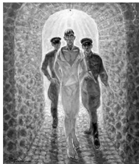
Н. Гетман, «В подвалах НКВД (памяти брата посвящается)».

Картины Гетмана запечатали множество горьких отметин: «Реабилитированный»