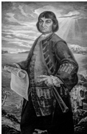
В. Ефимов, «Витус Беринг».

Искусствоведы отмечают: «Глубокие знания исторического материала позволили создать поэтические образы героев российской истории. В. Н. Ефимов первый создал образы участников камчатских экспедиций.