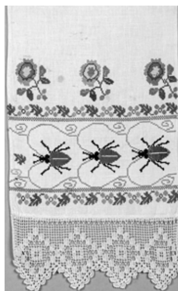
ХКМ КП 12450. Полотенце. 1940-е – 1950-е годы.

реже на постельном белье, скатертях и предметах одежды. Надписи вводятся мастерицами в орнамент и становятся равноправными элементами его художественной структуры. Кроме текстов, отдельных слов и словосочетаний шрифтовой орнамент содержит одно- и двухбуквенные монограммы, а также цифры. Они не являются обычными математическими знаками, а служат маркерами важных и значимых событий в частной жизни переселенцев.