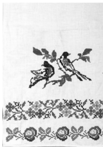
ХКМ КП 12329/10. Конец 1940-х годов.

на визуально-вербальный способ трансляции высказывания. Слово, облеченное мастерицами-вышивальщицами в графический знаковый образ — шрифт, приобретает важное значение, а древним композициям и орнаментам отводятся декоративные функции. В декорировании текстиля первой половины XX столетия эпиграфические мотивы появляются в большей степени на полотенцах,