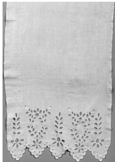
ХКМ КП 10060/6. Полотенце. 1-я четверть XX века.

Доктор искусствоведения И. Я. Богуславская в своём исследовании пишет: «Богатая орнаментика вышивки жила полнокровную жизнью, находясь в постоянном движении. Каждый пласт развивался своим путём и оказывал воздействие на другие. Менялся смысл древних изображений, из магических и мифологических знаков они превращались в декоративные узоры. Происходили сложные совмещения и трансформация разновременных по происхождению фигур. Они несли с собой в вышивку черты различных культур и стилей, влияние других народов и господствующих вкусов. И всё это соединялось в медленно, но сильно текущем потоке орнаментального искусства, соединялось не механически, но в новых сплавах и