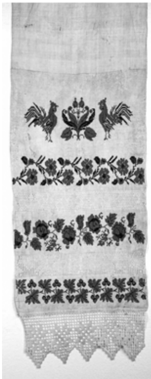
ХКМ КП 6701/1. Полотенце. 1-я четверть XX века.

геометрическом стиле, нередко заменяется более детальными изображениями, где образы решаются в реалистическом ключе. Изменение семантики древних мотивов в данных композициях — их отрыв от древней мифологической основы, приводит к утрате ценности сакрального смысла орнамента и преобладанию его эстетической функции. К примеру, в вышивках славян-переселенцев из коллекции Хабаровского краевого музея имени Н. И. Гродекова (далее — Гродековский музей), в поздних вариациях трёхчастных композиций, зачастую изменяется суть этого древнего сюжета. Вышивка этой композиции представлена в различных вариациях, но уже трансформированной, с утратой строгой геометрии при изображении антропоморфной (женской) фигуры и дерева. В большей степени — в виде дерева-куста с