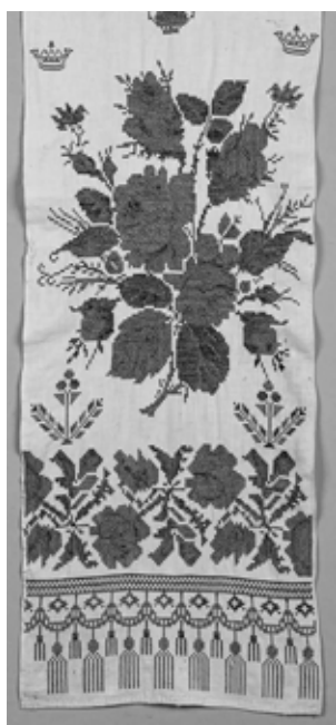
ХКМ КП 9967/1. Полотенце. 1-я четверть XX века.

древних сюжетов, динамика в передаче образов людей и животных, внесение конкретных деталей, отражающих социальную среду и деревенский быт, хорошо знакомый крестьянам-переселенцам несложный мир людей, домашних животных, птиц, растений, сельских изб. Новая трактовка сюжетной вышивки, почерпнутая из печатных образцов, утрачивает условное геометрически-прямолинейное решение и приобретает большую реалистичность и детализацию.