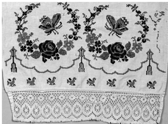
ХКМ КП 12329/9. Полотенце. 1-я четверть XX века.

Характерной особенностью текстильных композиций этого времени стало наличие текстов. Эта особая группа новых мотивов вышивки и узорного ткачества ярко демонстрирует результат замены традиционного орнаментального языка