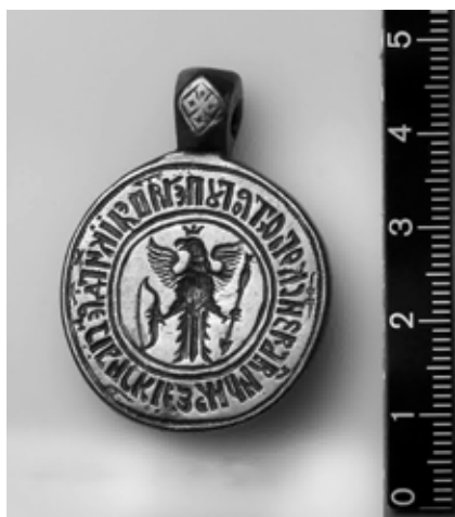
Печать Албазинского воеводства.

Готовый проект оставался без высочайшего утверждения десять лет. Только 5 июля 1878 года Александр II утвердил герб Амурской области. Эскизу благовещенского герба предстояло ещё треть века пролежать в архиве Гербового отделения. Долгожданный указ Николая II, которому предшествовала десятилетняя бюрократическая волокита, был подписан только 1 февраля 1912 года [10, с. 61–64].