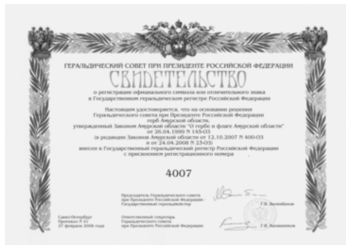
Свидетельство о государственной регистрации герба Амурской области.

Таким образом, в Российской Федерации была создана упорядоченная система официальных символов и отличительных знаков. В основе этой системы лежит принцип