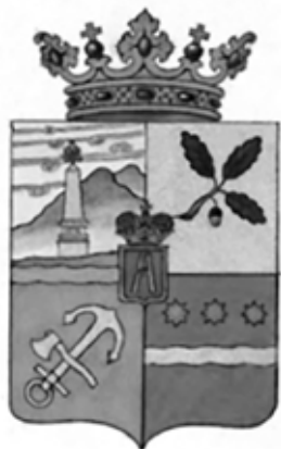
Проект герба Алексеевска.

На рассмотрение императора были поданы оба проекта. 11 февраля 1915 года Николай II утвердил проект, разработанный Гербовым отделением [6, с. 51–62]. Но просуществовал он недолго: спустя два года грянула революция. Охваченные революционной эйфорией, алексеевцы отказались не только от венчального герба, но и от собственного имени, придумав городу новое название — Свободный.