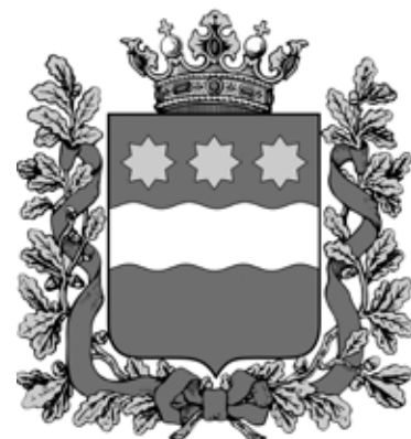
Герб Амурской области, утверждённый в 1878 году.