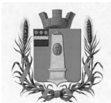
Утверждённый герб Алексеевска.