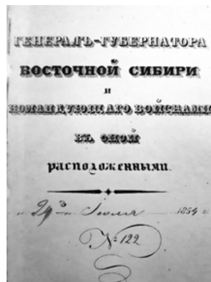
Угловой штамп Н. Н. Муравьёва

...Первые, в числе 400 человек, должны быть немедленно перевезены в Петропавловский порт, а с ними должен отправиться туда и я сам, для надлежащих, к защите сего пункта, распоряжений, поэтому имею честь убедительнейше просить Ваше Превосходительство прислать в Де-кастри один из фрегатов, сколь можно поспешите, ибо усиление Петропавловского гарнизона не терпит ни малейшего отлагательства. По всем изложенным, в выше-сказанных отношениях Вашего Превосходительства, предметам, а также и по другим, до защиты портов и берегов России в здешней стране, относящихся, я имею самую крайнюю необходимость видеть-