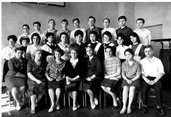
Выпускники 26-й школы