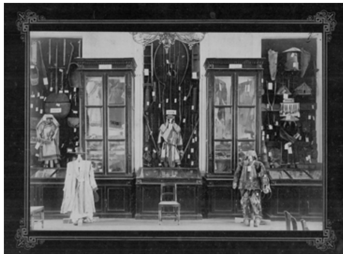
Музей ОИАК. Начало XX века