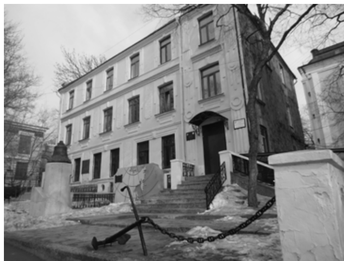
Современное здание ОИАК по адресу: Владивосток, улица Петра Великого, 4