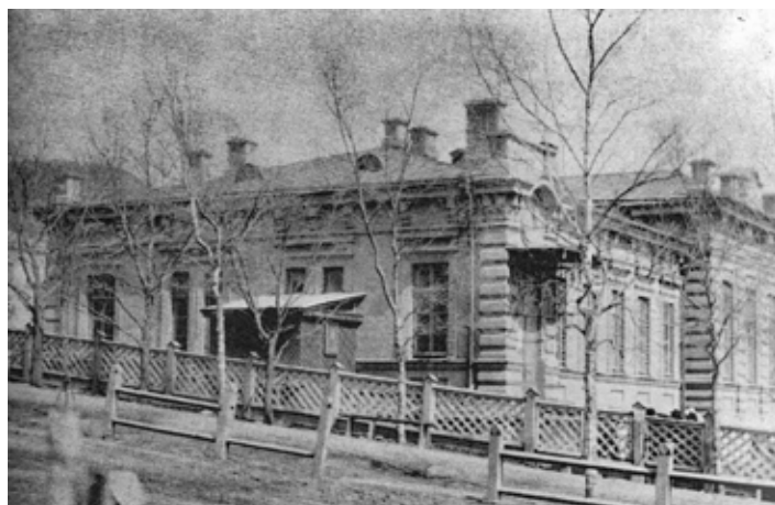
Здание Общества изучения Амурского края. Конец XIX века