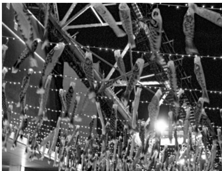
Украшения в виде карпов у Токийской телебашни в апреле

Сезонное оформление весенней Японии кардинально отличается. Основным событием этого времени года является цветение сакуры — ханами (花見, «любование цветами»). Следовательно, декорации также повторяют цветочные мотивы, но, в отличие от России, символом весны в Японии является цветок сакуры. Активно применяются традиционные японские фонарики, в основном тётин (提灯, «свет, который несут») и андон (行灯, «идуший свет»).