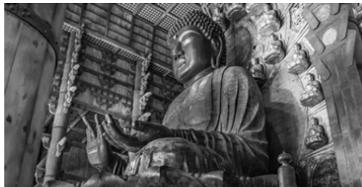
Гигантский бронзовый Будда в храме Тодай-дзи в Наре

Смешение разнородных элементов, ставшее особенностью камакурской пластики, в конечном итоге привело к нарушению её былой образной цельности и стилистического единства. В то же время в лучших произведениях, созданных камакурскими ваятелями,