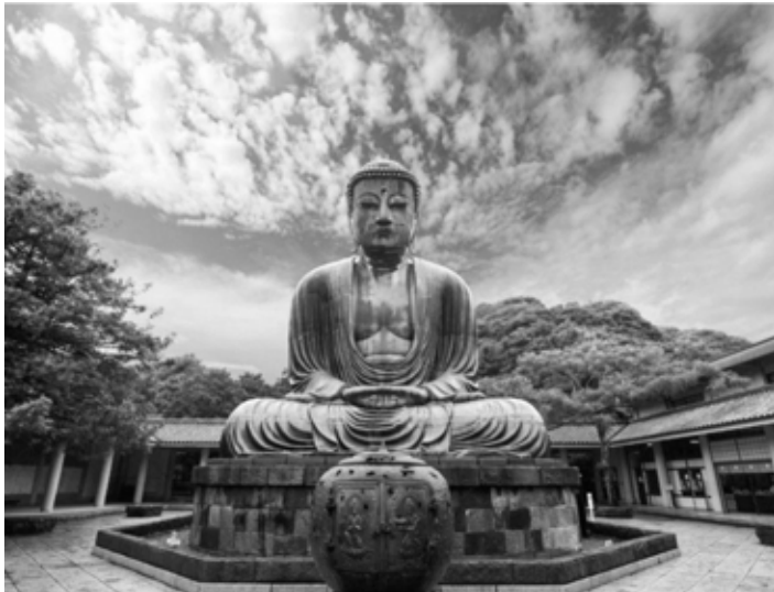
Статуя Будды в Камакуре

нашли своё яркое и подчас более непосредственное, чем прежде, выражение драматизма эпохи и духовная стойкость её героев [2].