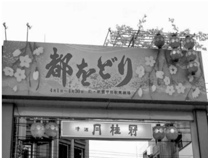
Праздничное оформление улицы в Киото, Япония