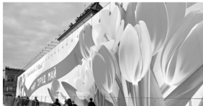
Москва, сезонное оформление, 1 Мая