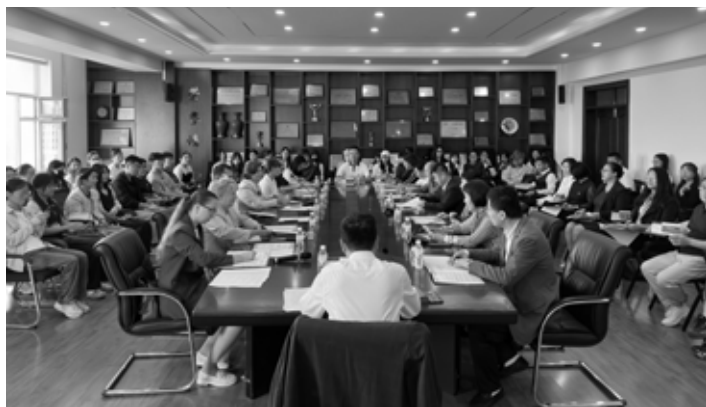
Обмен опытом с китайскими коллегами по вопросам функционирования библиотек

китайском и русском языках. Русские традиции заметны в гастрономии и кулинарии: в выпечке хлеба, производстве колбас и мороженого.