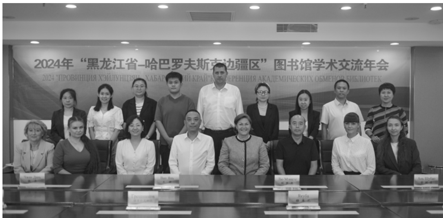
Участники IX Международного библиотечного форума «Хабаровский край — провинция Хэйлунцзян», Харбин

Следует отметить, что немаловажное значение для развития сотрудничества Дальневосточной государственной научной библиотеки и Хэйлунцзянской провинциальной библиотеки приобретает беспрецедентно высокий уровень двусторонних отношений Российской Федерации и Китай-