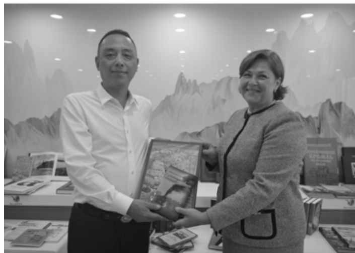
Книжная коллекция ДВГНБ, переданная в дар Хэйлунцзянской провинциальной библиотеке