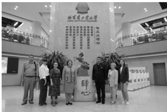
Делегация ДВГНБ в библиотеке Харбинского политехнического университета

В рамках научной программы состоялся визит хабаровской делегации в библиотеку знаменитого Харбинского политехнического университета (ХПУ), который входит в Союз девяти лучших университетов Китая, а также занимает шестое место в списке лучших мировых инженерных университетов. Это ключевой национальный университет, ядром которого являются наука и инженерия. ХПУ основал первую школу астронавтики в Китае, первым самостоятельно разработал и вывел на орбиту Луны небольшие спутники и внедрил спутниковую наземную лазерную линию связи, провёл первые эксперименты по обслуживанию космического оператора человеком-машиной на орбите. Библиотека вуза владеет обширными академическими коллекциями и литературными ресурсами, служит единой цифровой библиотечной базой Китайской академической библиотечно-информационной системы и центром документации и информации при университетских библиотеках провинции Хэйлунцзян. Здание библиотеки состоит из пяти этажей. Всё пространство — общедоступно, все книги находятся в открытом доступе, так как библиотека полностью интерактивная. Запрос на выдачу нужной книги студенты осуществляют через электронный терминал и находят книгу без участия библиотекаря. Здесь же располагается интерактивная зона для самообразования, интеллектуального досуга и отдыха