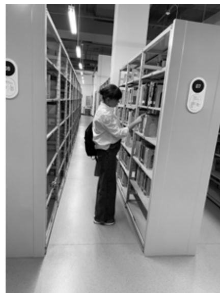
На экскурсии по пятиэтажной библиотеке Харбинского политехнического университета

На встрече присутствовало партийное руководство вуза и студенты Института информационного менеджмента. Особый интерес китайские коллеги проявили к обслуживанию в ДВГНБ особых групп населения, наличию этнографических изданий о Дальнем Востоке и коллекций древних китайских книг. Во время экскурсии по фондам библиотеки