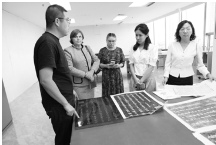
Экскурсия в отдел реставрации книжных памятников

все библиотеки провинции. В читальных залах библиотеки установлена автоматизированная система определения расположения книг на стеллажах. Реализована автоматическая система книговыдачи и возврата книг без участия сотрудников библиотеки. Подключены мультимедийные настольные считыватели, станции самостоятельной книговыдачи, самостоятельного книговозврата, корзины с подвижным дном для возврата книг, противокражные системы и другие системы автоматизации библиотечных процессов. Высокий уровень технического оснащения библиотеки позволяет ей работать с читателями в круглосуточном режиме.