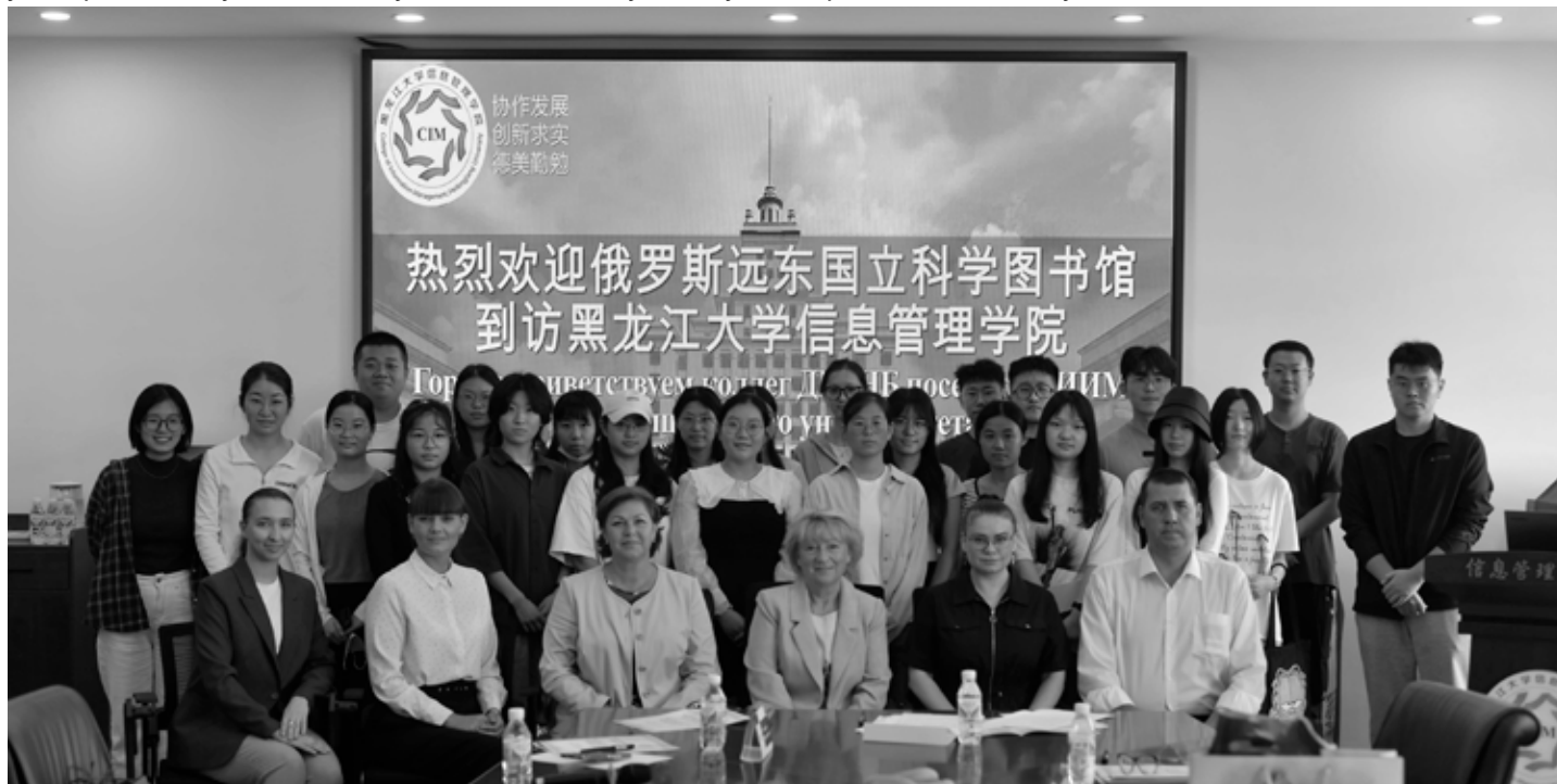
Делегация ДВГНБ со студентами Института информационного менеджмента

Культурная программа форума включала в себя посещение музея города Харбина и Выставочного зала планирования Харбина. Выставочный зал города Харбина — это захватывающее путешествие в архитектурное прошлое, настоящее и будущее города с 12-миллионным населением. Музей оборудован огромными проекционными экранами, транслирующими современную архитектуру Харбина в 3D-формате, что делает путешествие во времени наглядным и реалистичным. В залах представлено много макетов исторических зданий города и моделей будущих футуристических проектов, которые будут смело воплощаться и менять нынешний облик Харбина. За короткое время можно посетить всё географическое пространство Харбина, увидеть его стремительное экономическое развитие, начиная с русской истории строительства города и до наших дней. Харбин был основан в 1898 году и построен русскими архитекторами как узловая станция Китайско-Восточной железной дороги, соединяющая наиболее коротким путём Сибирь с Владивостоком. Экспонаты нескольких залов подробно рассказывают о периоде строительства КВЖД, о бурной жизни русской эмиграции в послереволюционные годы до середины XX века. Влияние русской культуры заметно и на центральных улицах Харбина. Атмосферу русской эпохи создаёт множество зданий и резиденций, возведённых в стиле русской архитектуры, среди которых несколько православных церквей и Софийский собор. Сохраняется память о прежних владельцах зданий, их фамилии и род деятельности указан на металлических табличках на