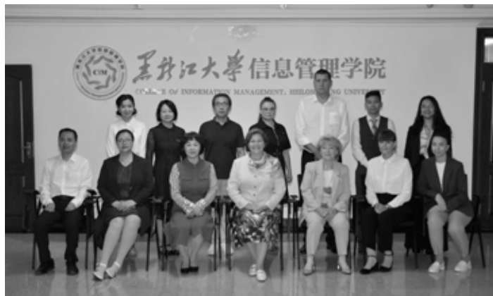
Вместе с профессорско-преподавательским составом Института информационного менеджмента

Дружеские отношения между странами создают очень хорошую среду для международного сотрудничества в области библиотечного дела. ДВГНБ планирует развивать профессиональные контакты с другими библиотеками КНР. Продолжается книгообмен с Хэйбэйским педагогическим