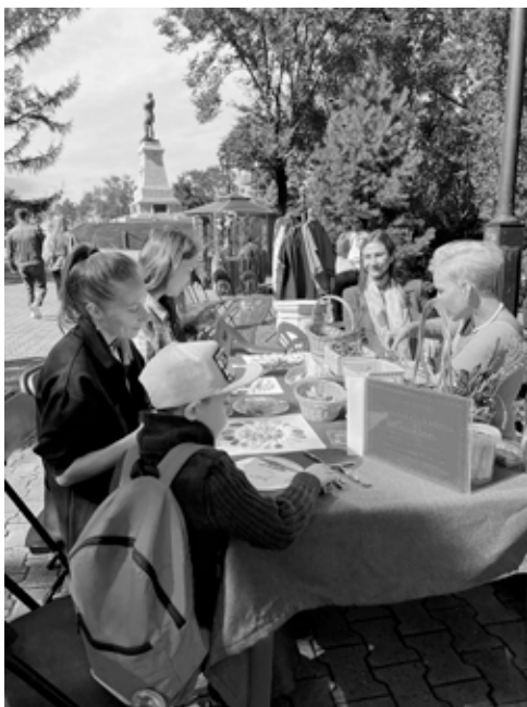
Создание экомандалы на фестивале инклюзивных событий «Брайлиана». Сентябрь 2024 года

ду ХКСБС впервые организовала и провела масштабное краевое мероприятие — фестиваль инклюзивных событий «Брайлиана». Он был приурочен к 215-летию со дня рождения создателя азбуки для незрячих и слабовидящих людей Луи Брайля и прошёл при поддержке министерства культуры Хабаровского края на площадке Хабаровского краевого парка имени Н. Н. Муравьёва-Амурского. Фестиваль был направлен на