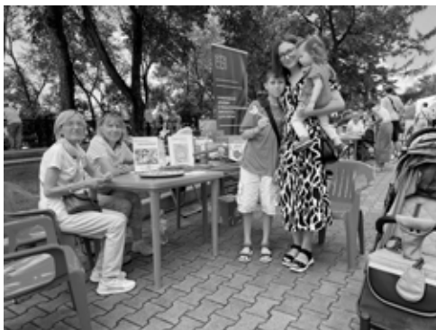
На фестивале «Золотая Ригма» в августе 2024 года