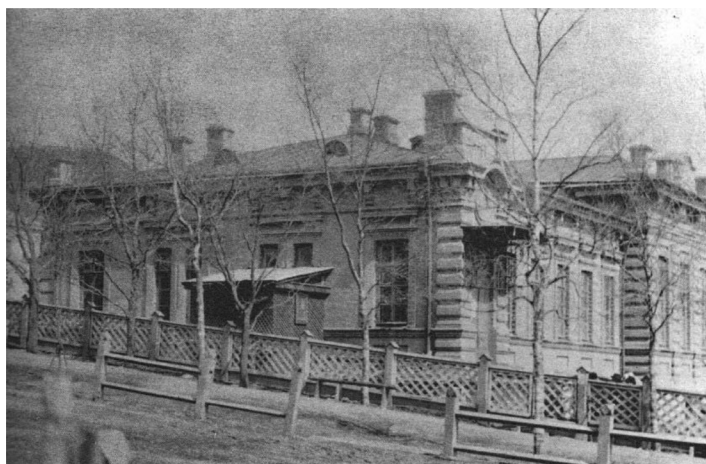
Здание Общества изучения Амурского края по адресу: Владивосток, улица Петра Великого, № 6