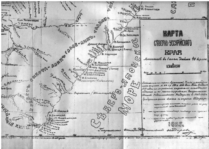
Карта северной части Приморского края, составленная подполковником И. П. Надаровым в 1882–1883 годах

или менее уже ознакомившись с краем и его обитателями, я получил возможность отложить в сторону менее достоверные расспросные сведения и руководствовался лишь теми, которые я считал более достоверными» [8, с. 2].