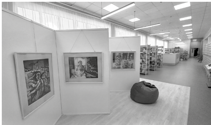
Центральная районная библиотека имени М. Горького в Советской Гавани

точку сосредоточения культурной жизни города, особенно если он небольшой» [5].