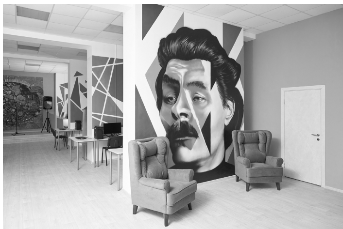
Центральная детская модельная библиотека имени М. Горького