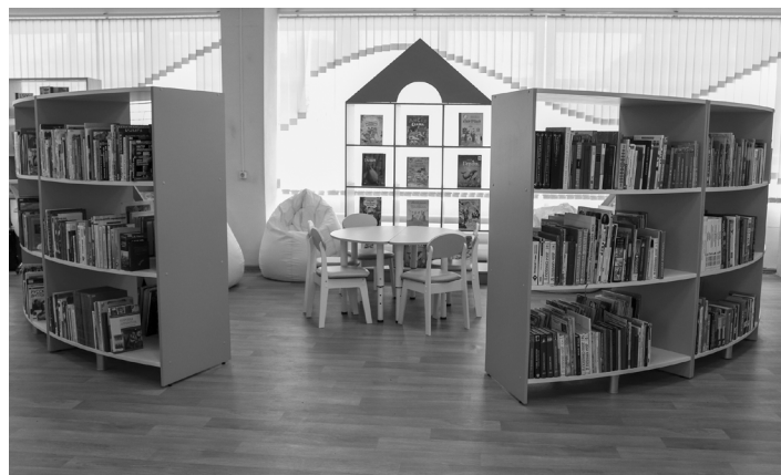
Центральная библиотека № 17 посёлка Эльбан

Помимо уже указанных функций, проектный офис организует необходимые исследования и сбор материалов, координирует реализацию мероприятий регионального