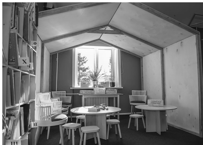
Вот такой уголок для читателей появился в Межпоселенческой библиотеке Хабаровского муниципального района

По словам сотрудников Центральной библиотеки посёлка Чегдомын, после модернизации библиотека стала центром притяжения для всех жителей посёлка. «На площадках учреждения проводит встречи глава Верхнебуреинского муниципального района, здесь прошли юбилейные мероприятия градообразующего предприятия; молодёжные организации, спортивные объединения и жители посёлка всё чаще назначают встречи в стенах библиотеки» [6, с. 63].