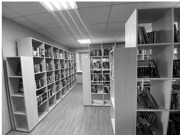
Централизованная библиотечная система в посёлке Ванино

Авторы проекта «Верба» для Центральной городской библиотеки имени П. Комарова в Хабаровске, получившие по результатам конкурса диплом первой степени, отметили, что похожие проекты они делали в рамках обучения, «но именно такой, общественно полезный, в нашей практике впервые. Его цветовое решение — светлые пастельные тона с яркими элементами: зелёными растениями, какими-то особенными уголками. Безусловно, мы учитывали мнение сотрудников библиотеки и её посетителей. Главный запрос — создать комфортную среду, где можно отдохнуть, собраться вместе для общения или проведения мероприятий. Сегодня библиотеки трансформируются и переходят в