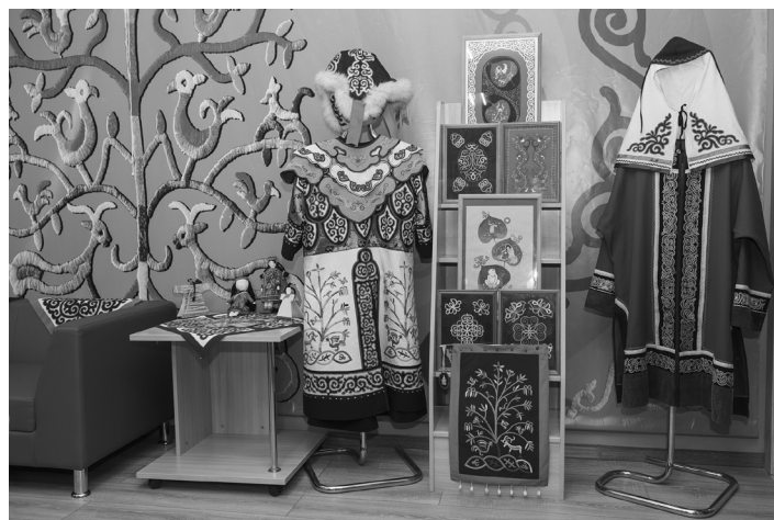
Межпоселенческая библиотека в селе Троицком