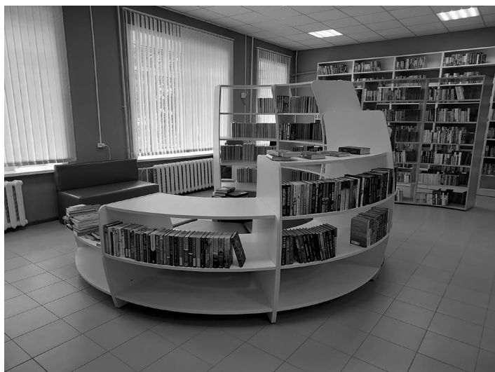
Дизайн-проект для Николаевской районной библиотеки выполнен студентами-архитекторами Тихоокеанского государственного университета

медийным и игровым оборудованием; музейная зона с выставочно-экспозиционным пространством, а также зона для самостоятельной работы пользователей в Интернете. Для детей и подростков в библиотеке теперь есть комфортные условия: специальная яркая удобная мебель, настольные игры, новые книги [3, с. 53–54].