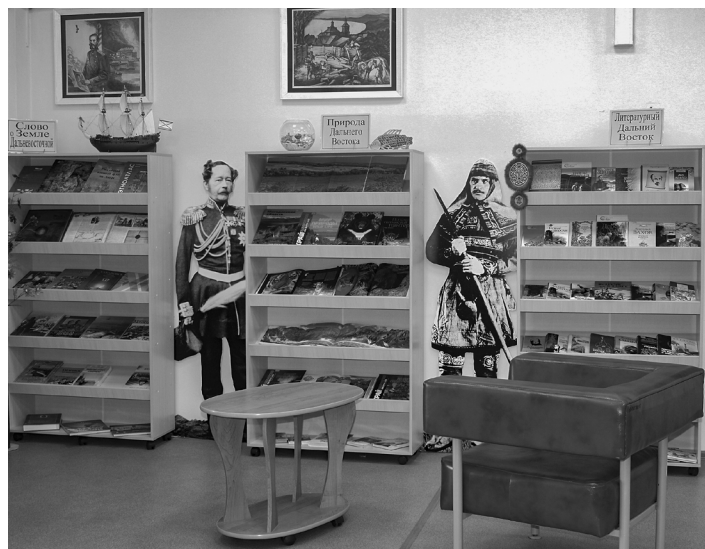
Библиотека-филиал № 4 в Хабаровске