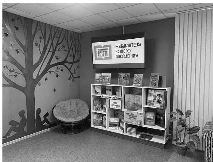
Один из уголков Центральной библиотеки посёлка Чегдомын