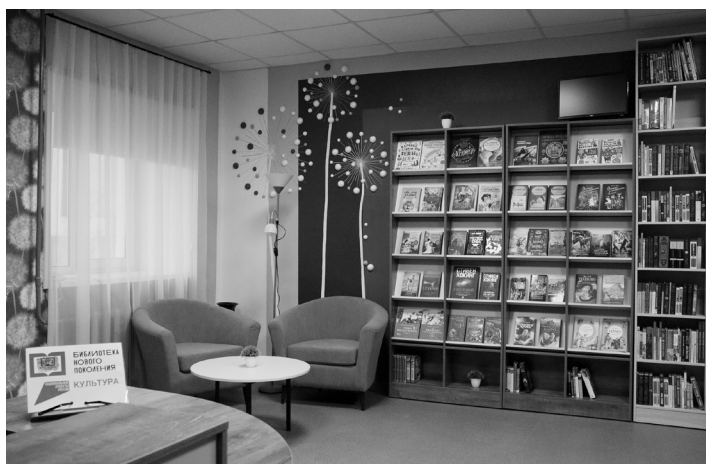
Центральная детская библиотека посёлка Чегдомын

по 2025 год библиотек, уступая Республике Саха (Якутия), Республике Бурятия, Амурской области (по 19 библиотек) и Забайкальскому краю (18 библиотек) [8].