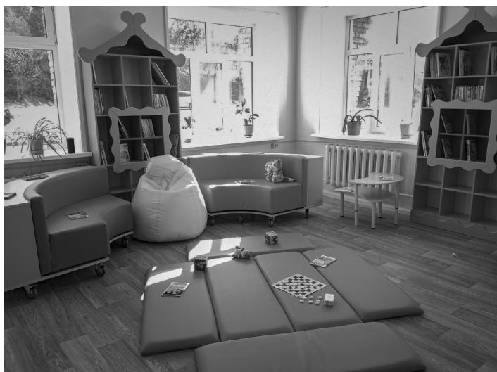
Игровая зона в городской библиотеке Амурска